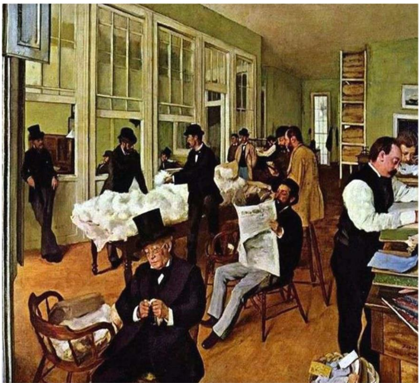
Edgar Degas, Oficina de algodón en Nueva Orleans, 1873. Pintura.