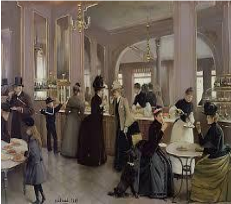
Béraud, Jean (1889). Pastelería Gloppe en los Campos Eliseos. Pintura.