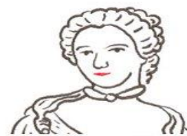
Emilie du Châtelet