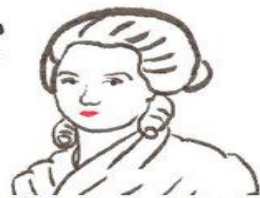
Olympe de Gouges